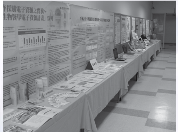
圖2：醫圖各項活動海報及檔案展示