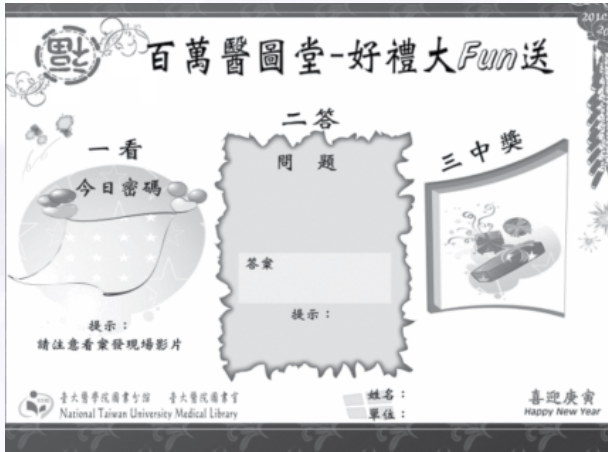
圖8：百萬醫圖堂活動卡