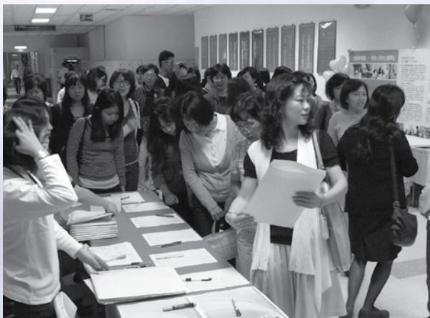
圖3：與會人員報到盛況