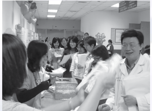
圖9：百萬醫圖堂活動情形