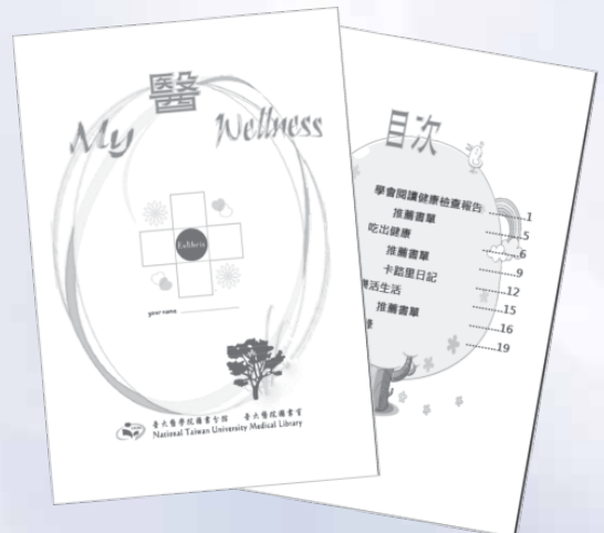
圖11：「My 醫 Wellness」小冊子