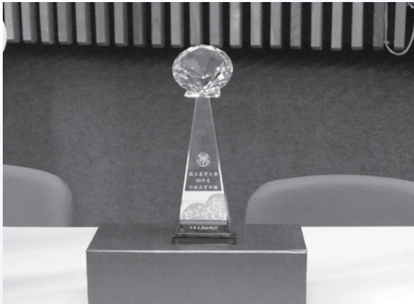
圖5：98年度標竿學習獎盃