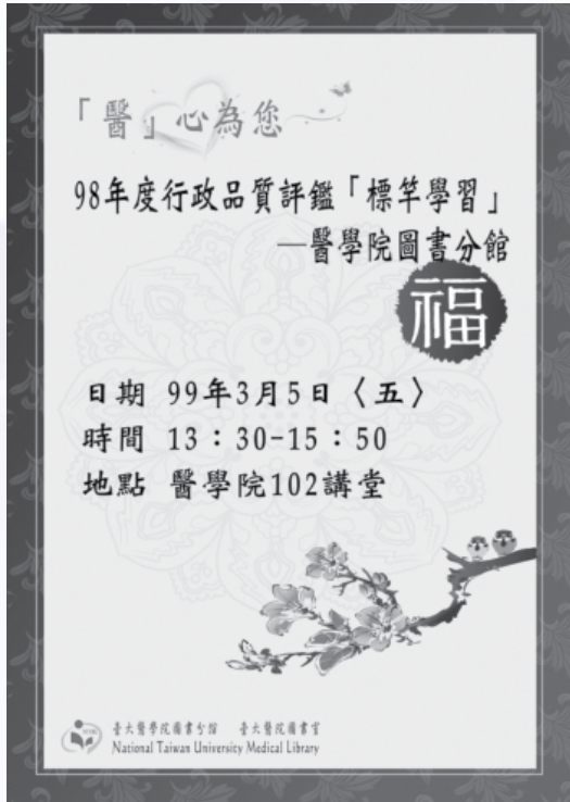
圖1：標竿學習活動海報