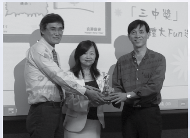
圖4：主秘頒發98年度標竿學習獎盃