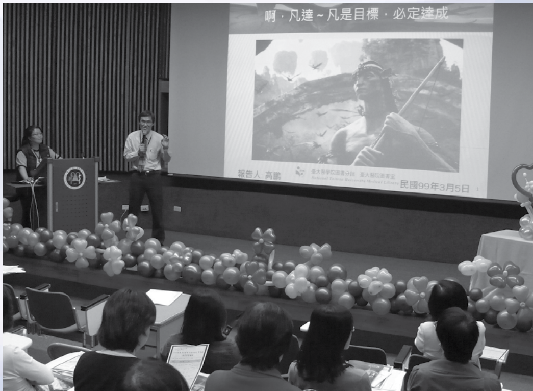
圖7：本館高主任簡報