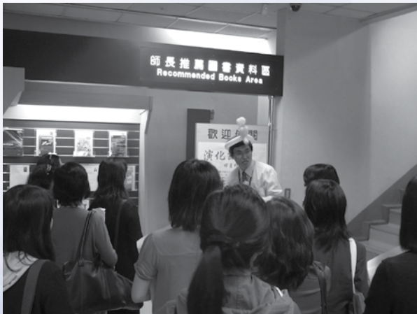
圖10：與會貴賓參加「泡圖書館」情形