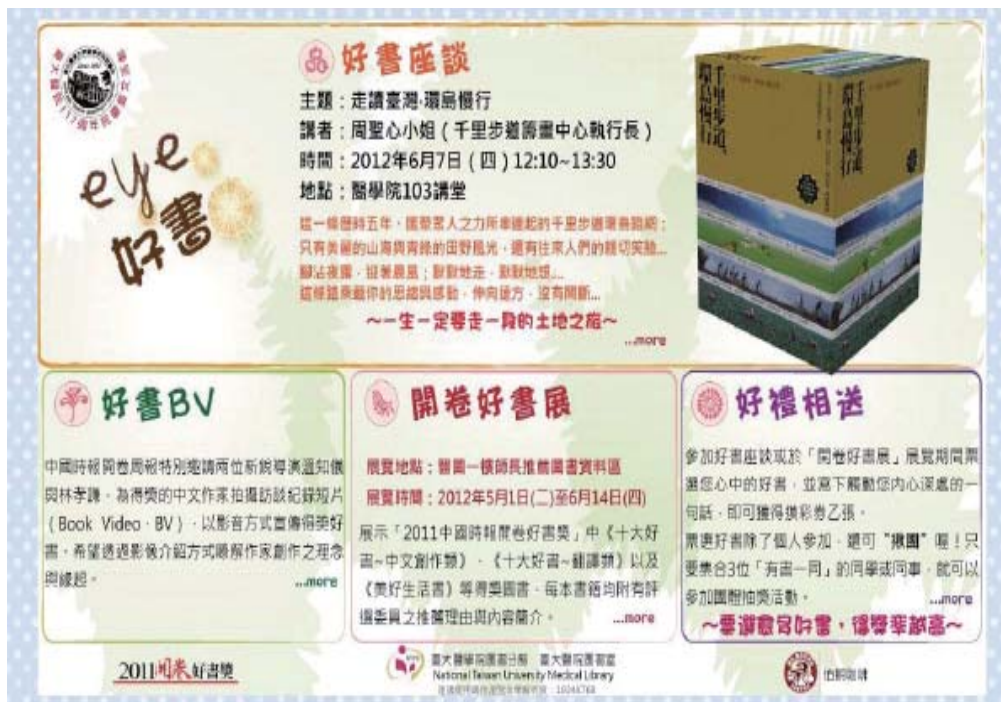
圖1：活動主題網頁 ( http://ntuml.mc.ntu.edu.tw/events/eyebook2012/index.html )

為提升醫學人文素養與閱讀氛圍，本館於臺大醫院第 117 周年院慶藝文活動與中國時報開卷周報合作，舉辦「Eye 好書」開卷好書獎展覽暨好書座談系列推廣活動，讓醫學校區的讀者享受閱讀的樂趣並提升更寬闊的視野。茲將系列活動花絮分享如下：