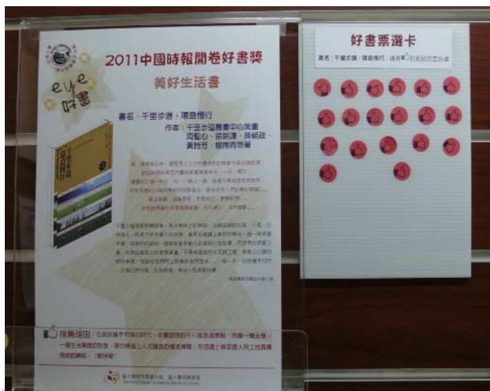
圖4: 由讀者親自黏貼本館特製的「給你一個讚」貼紙