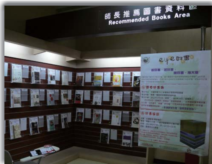
圖2: 開卷好書展覽現場