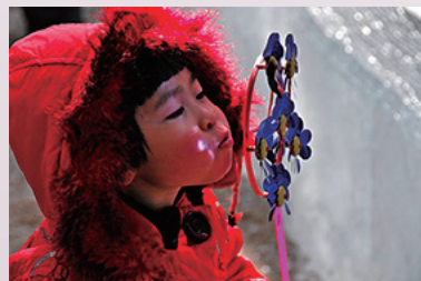
北京小女孩