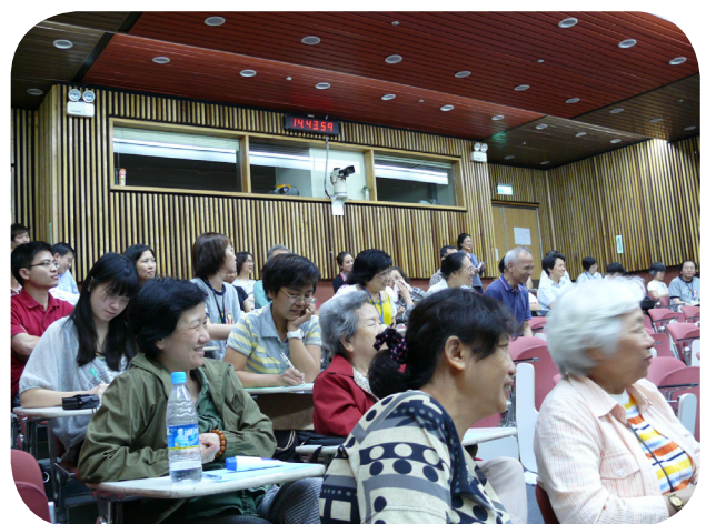
圖2：現場觀眾回應熱烈